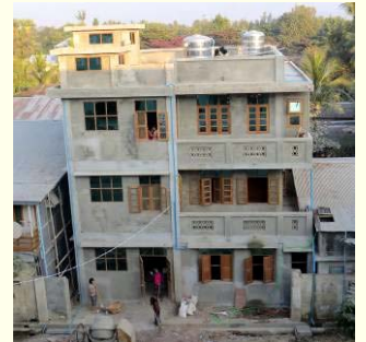
Huis 2 (nieuw)