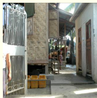
Huis 3 (bamboehuis)