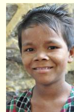
Shine Bo Bo