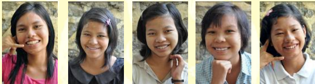
Eain Thit Sar Mee Mee Cho Zin Win Yin Yin Aye Thu Zar Win

Jongeren uit The Golden House, die gemotiveerd zijn om na hun middelbare school verder te studeren, worden daarbij ondersteund (binnen de financiële mogelijkheden van de stichting). We hebben hiertoe een studiefonds in het leven geroepen, dat gesteund wordt door stichting Frangipani uit Nederland. Een vervolgstudie in Myanmar kost zo'n € 300,- per persoon per jaar. We reserveren per jongere een bedrag van € 1.200,- voor de gehele studie. Nadat ze hun vervolgstudie hebben afgerond, kunnen ze op zoek gaan naar een baan waarmee ze in hun eigen levensonderhoud kunnen voorzien en The Golden House kunnen verlaten. Op dit moment zijn acht jongeren op kosten van de stichting bezig met een vervolgstudie (en één op kosten van PDO High School). We hopen deze groep in de toekomst verder te kunnen uitbreiden. Een deel van onze jaarlijkse sponsoropbrengsten gaat naar het studiefonds.