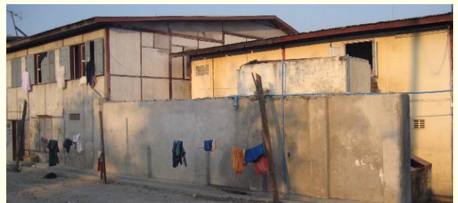
Hierboven de woonsituatie van het eerste uur en hieronder de huidige woonsituatie (huis 2, huis 1 en Pandaw House).

Inmiddels is die huisvesting helemaal op orde. De drie gebouwen vragen jaarlijks om onderhoud en reparatie. Enkele zaken kunnen nog verbeterd worden. Denk aan het rioleringssysteem. We zouden ook graag het middelste huis (huis 1) willen betegelen en vanbinnen schilderen. Een wens is de aanleg van een (dak)tuin om rustig te kunnen studeren. Betere keukenapparatuur staat ook op het verlanglijstje, evenals extra meubilair voor studie en bijles.