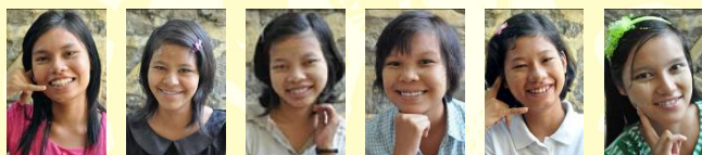
Eain Thit Sar Mee Mee Cho Zin Win Yin Yin Aye Thu Zar Win Thet Thet Swe

Jongeren uit The Golden House, die gemotiveerd zijn om na hun middelbare school verder te studeren, worden daarbij ondersteund (binnen de financiële mogelijkheden van de stichting). We hebben hiertoe een studiefonds in het leven geroepen. Dit wordt gesteund door stichting Frangipani uit Nederland. Een vervolgstudie in Myanmar kost zo'n € 300,- per persoon per jaar. We reserveren per jongere een bedrag van € 1.200,- voor de gehele studie. Nadat ze hun vervolgstudie hebben afgerond, kunnen ze op zoek gaan naar een baan. Hiermee kunnen ze in hun eigen levensonderhoud voorzien en kunnen ze The Golden House verlaten. Op dit moment zijn negen jongeren bezig met een vervolgstudie aan de deeltijduniversiteit. Een deel van de jaarlijkse sponsorbrengsten gaat naar het studiefonds.