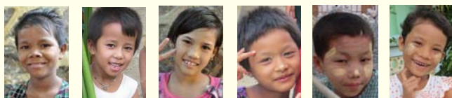
Shine Bo Bo Aye Li Su Htet Myat Aye Naw Myat Min Kyaw D Dee